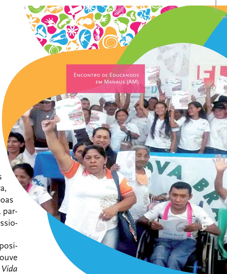
ENCONTRO DE EDUCANDOS EM MANAUS (AM)