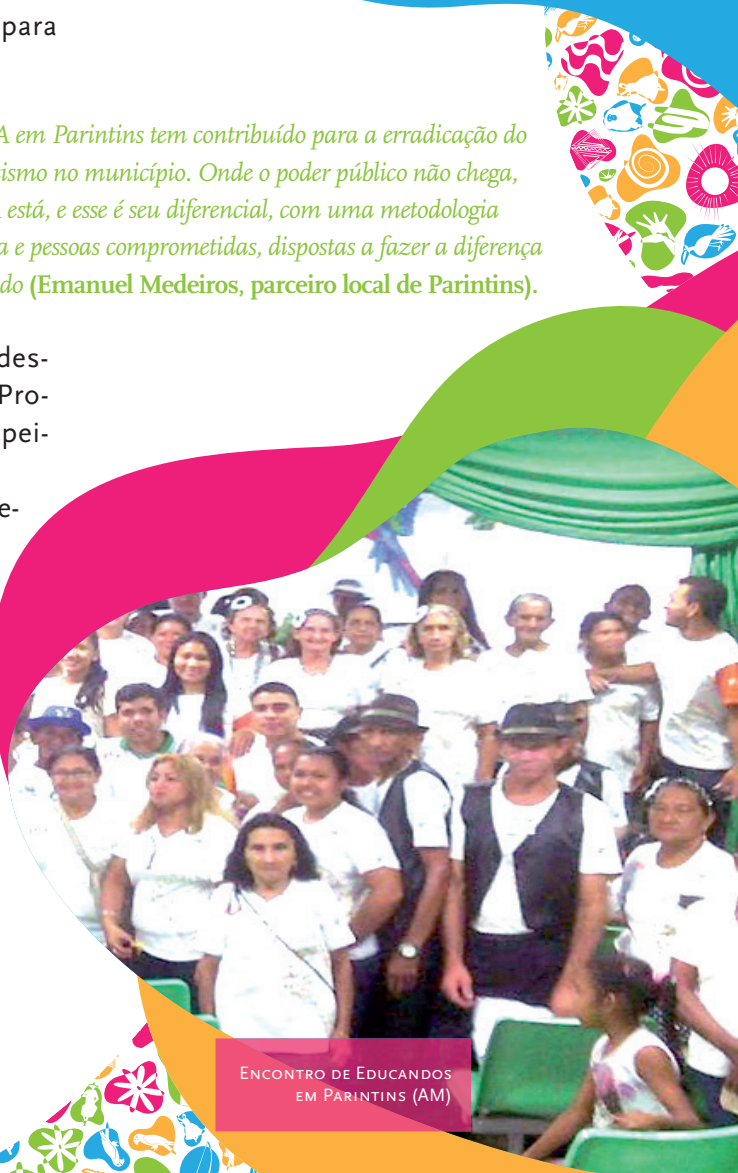
ENCONTRO DE EDUCANDOS EM PARINTINS (AM)