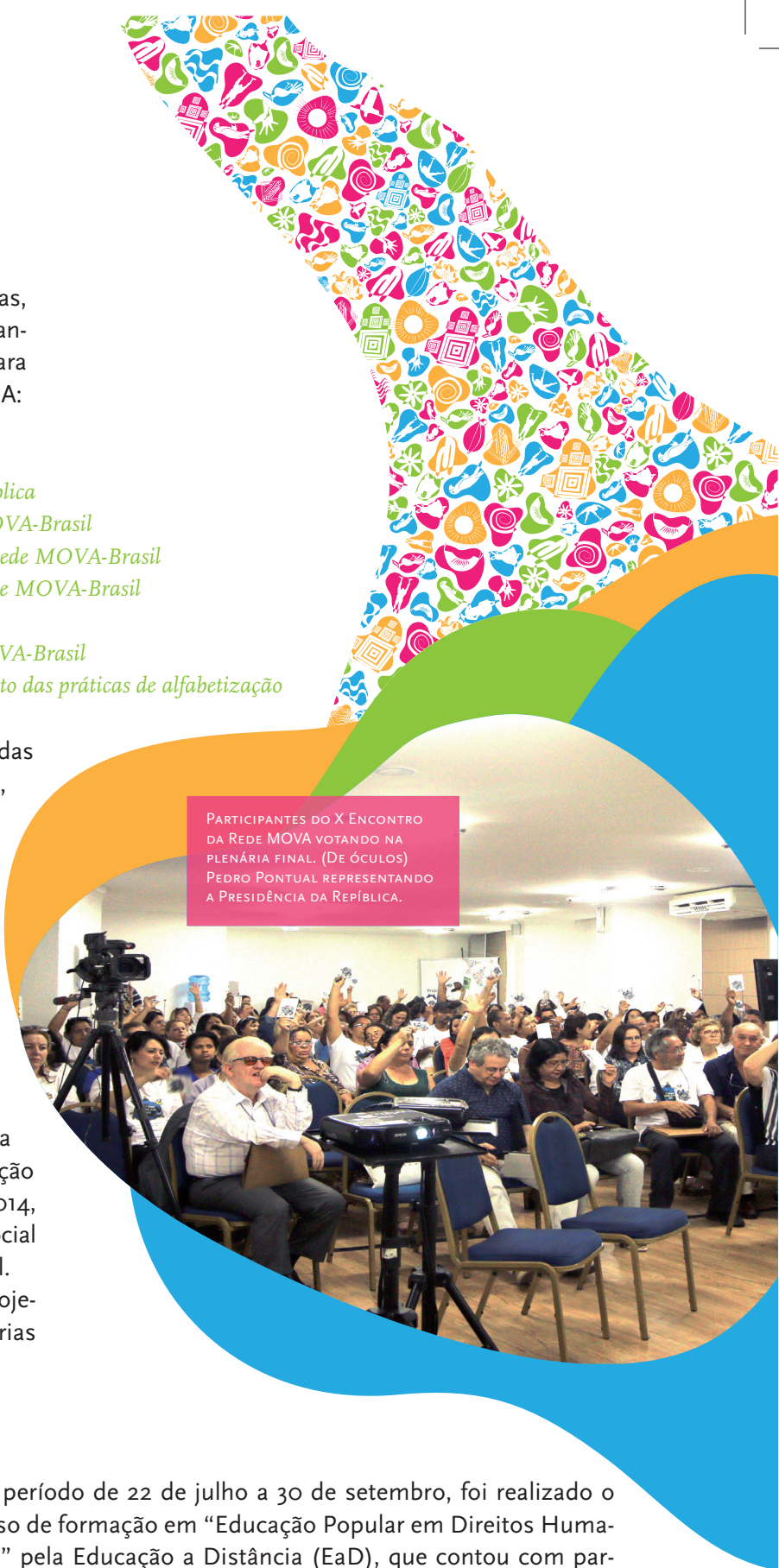
PARTICIPANTES DO X ENCONTRO DA REDE MOVA VOTANDO NA PLENÁRIA FINAL. (DE ÓCULOS) PEDRO PONTUAL REPRESENTANDO A PRESIDÊNCIA DA REPÚBLICA.

No período de 22 de julho a 30 de setembro, foi realizado o curso de formação em “Educação Popular em Direitos Humanos” pela Educação a Distância (EaD), que contou com participação de 15 pessoas, entre coordenadores de polos, assistentes pedagógicos, auxiliares administrativos e coordenação pedagógica nacional do MOVA-Brasil. O objetivo foi promover a formação em Educação Popular em Direitos Humanos, para consolidar como uma práxis político-cultural e pedagógica que estimule a formulação de propostas promotoras da justiça social, cultural e econômica.