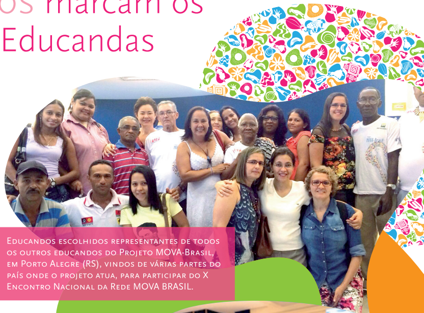
EDUCANDOS ESCOLHIDOS REPRESENTANTES DE TODOS OS OUTROS EDUCANDOS DO PROJETO MOVA-BRASIL, EM PORTO ALEGRE (RS), vindos de várias partes do país onde o projeto atua, para participar do X Encontro Nacional da Rede MOVA Brasil.

Neste boletim, os encontros regionais de educandos(as) abordaram a “Educação Popular em Direitos Humanos” e a “Formação profissional”, além de aspectos relacionados à leitura, escrita e matemática, questões políticas, éticas, culturais, respeito à diversidade e os Direitos Humanos em geral, debatidos para criar alternativas na construção de uma sociedade mais inclusiva, que cultiva a cultura da justiça social.